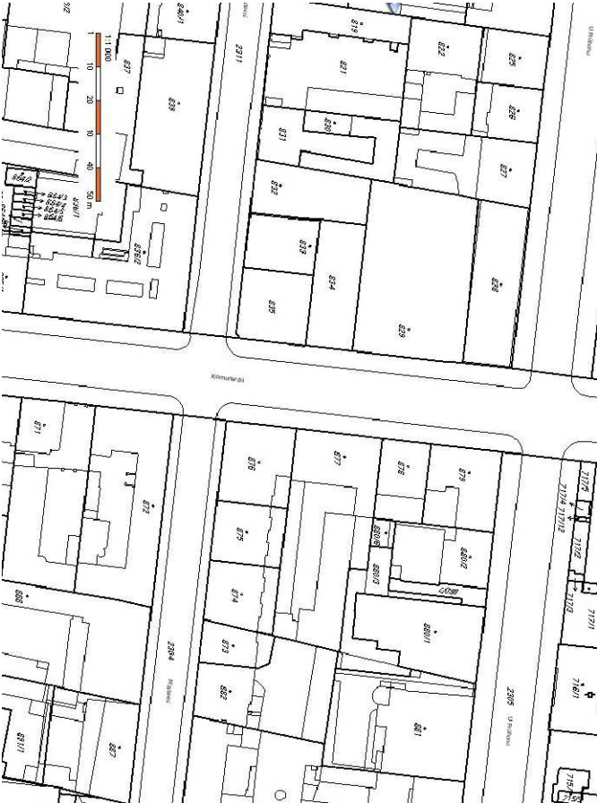
KATASTRÁLNÍ MAPA – STAV PŘED VÝSTAVBOU

SO.01 POLYFUNKČNÍ DŮM – 646,67 m 2 PLOCHA POZEMKU – 1642,57 m 2 PROCENTO ZASTAVĚNÍ – 39,36 %